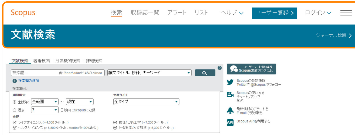
バージョンアップ後