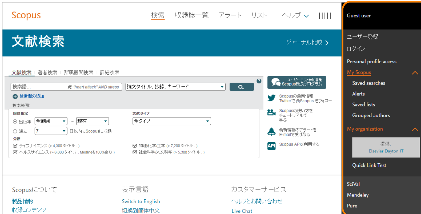
バージョンアップ後