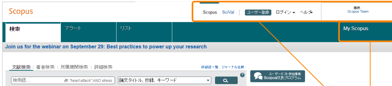
バージョンアップ前

バージョンアップ前のヘッダー部分のいくつかの項目が三本線メニューの中に移動しました。