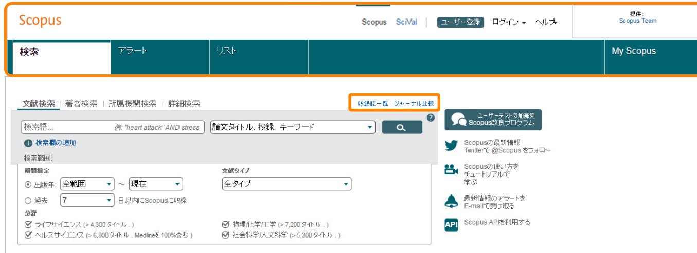
バージョンアップ前

ヘッダー部分のデザインが変更されました。今後のバージョンアップで、本体部分のデザインも変更されていく予定です。